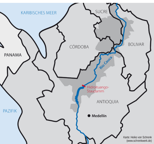
Karte: Heiko von Schrenk (www.schrenkwerk.de)

Die Flutkatastrophe hat ins öffentliche Bewusstsein gerückt, worauf Betroffene seit Jahren hinweisen: Hidroituango ist verantwortlich für unzählige Menschenrechtsverletzungen, Sozial- und Umweltrechtsverstöße. Deutsche Unternehmen – darunter die staatseigene KfW-IPEX-Bank, Siemens, die Rückversicherer Munich Re und Hannover Re, der Druckluftspezialist Kaeser und der Kabelhersteller Südkabel – hat das nicht von einer Kooperation mit dem Projekt abgehalten. Während den Verantwortlichen in Kolumbien mittlerweile auf den Zahn gefühlt wird, leben unzählige Menschen in der Projektregion auch Ende 2021 unter prekären Bedingungen. Viele haben ihr gesamtes Hab und Gut und ihre Einkommensquellen verloren. Die meisten warten weiter vergeblich auf Wiedergutmachung, Zukunftsperspektiven, Wahrheit, Gerechtigkeit und Schutz vor neuer Gewalt.