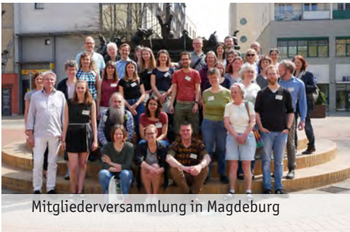
Mitgliederversammlung in Magdeburg

Zum Jahresende hatte FIAN Deutschland 1.319 Mitglieder und Fördermitglieder. Durch kontinuierliche Mitgliederwerbung konnte die Zahl – trotz einiger Abgänge und Todesfälle – um 49 erhöht werden.