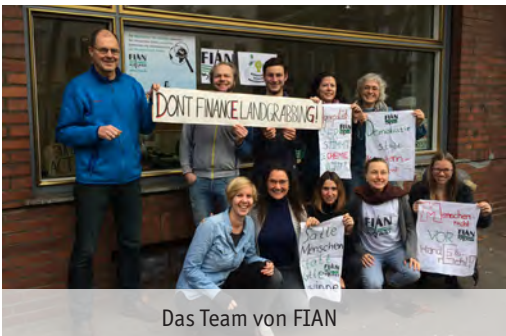
Das Team von FIAN