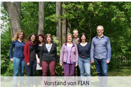
Vorstand von FIAN

Berlin, Bremen, Koblenz, Köln, Marl, München, Ruhrgebiet, Tübingen.