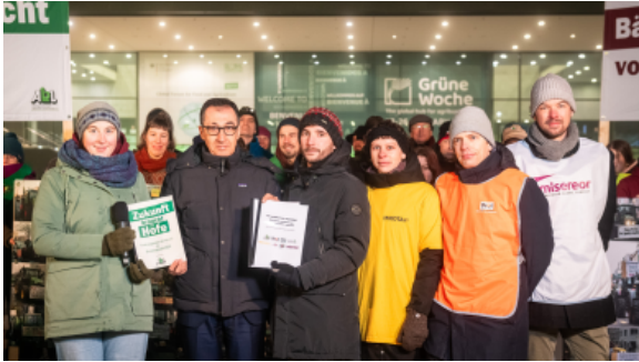
FIAN bei der Agrardemo in Berlin

Zum Jahresende 2025 hatte FIAN Deutschland 1.366 Mitglieder und Fördermitglieder. Trotz kontinuierlicher Werbung sank die Zahl somit um vierzehn – oftmals aufgrund von Todesfällen.