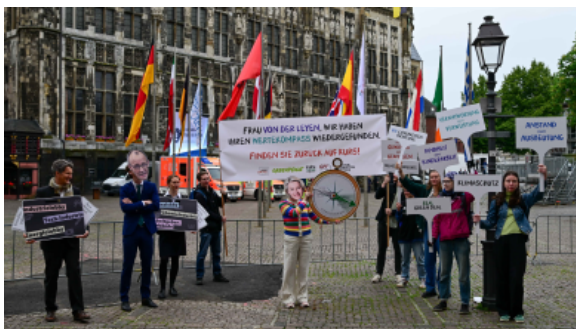
Protestaktion zur Verleihung des Karlspreises

Im Jahresverlauf waren in der Geschäftsstelle sechs Mitarbeiter*innen unbefristet und drei befristet beschäftigt. Alle Mitarbeiter*innen arbeiteten in Teilzeit (20 – 32h). Im Jahresverlauf wurde die Geschäftsstelle von neun Praktikant*innen (je drei Monate), zwei Bundesfreiwilligen und einem Rechtsreferendar unterstützt.