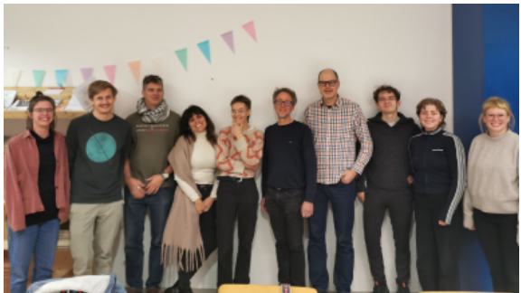
Treffen der europäischen FIAN-Sektionen in Wien